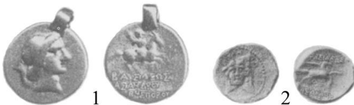
Рис. 1. Золотая и бронзовая монеты, отнесенные В.А. Анохиным к выпуску царя Асандра Fig. 1. Gold and bronze coins attributed by V.A. Anokhin to the release of King Asander