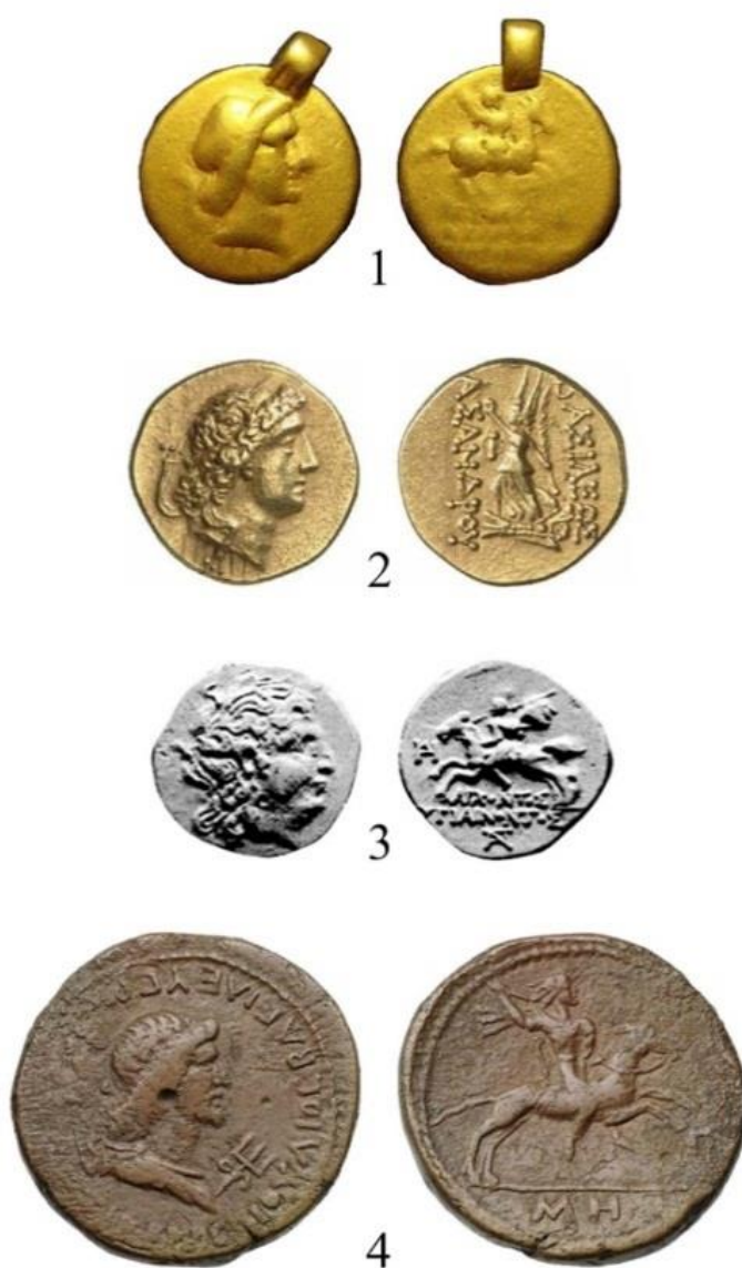
Рис. 2. К атрибуции золотой монеты: 1 – ее качественное фото; 2 – статер Асандра; 3 – драхма Гигиэонга, 4 – сестерций Рескупорида I Fig. 2. To the attribution of a gold coin: 1 – its high-quality photo; 2 – stater of Asander; 3 – drachma of Hygiainon, 4 – sestertius of Reskuporid I