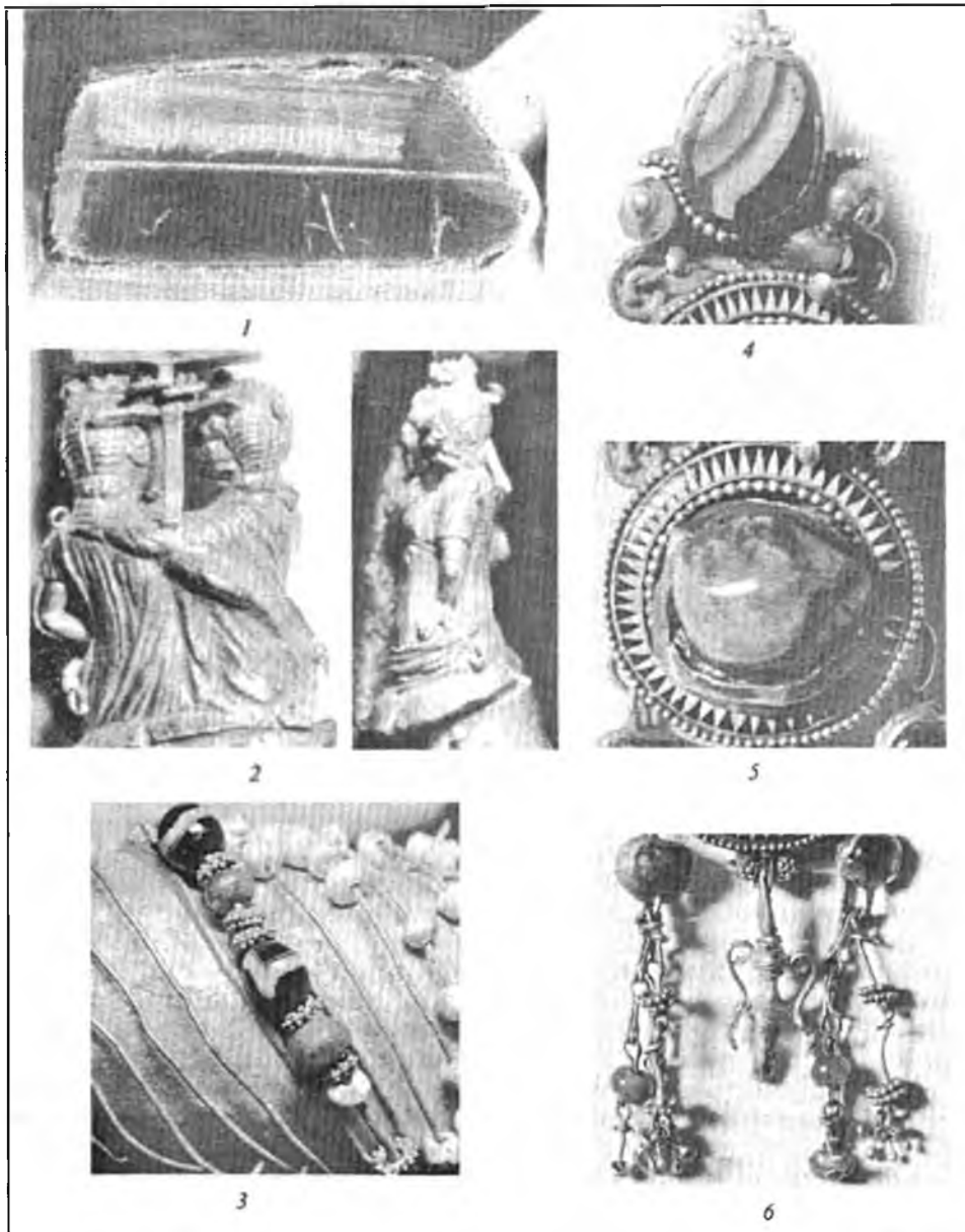
Рис. 3. Деталі браслета (1–3) і сережки (4–6)

Прикубання (гличик, брош-шпилька, кулон і т. ін.). У поєднанні з «царським» статусом небіжчиці ці спостереження роблять імовірним припущення, що в кургані могла бути похована одна з дочок Мітрідата, яку віддали заміж за «скіфського» царя. У цій ситуації обсипані перлами розкішні браслети із зображенням шлюбної пари Ерота і Псіхеї могли бути спеціальним весільним подарунком.